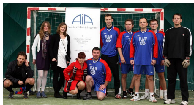
Vítězný tým Advokátní kanceláře Zrůstek, Lůdl a partneři v. o. s.