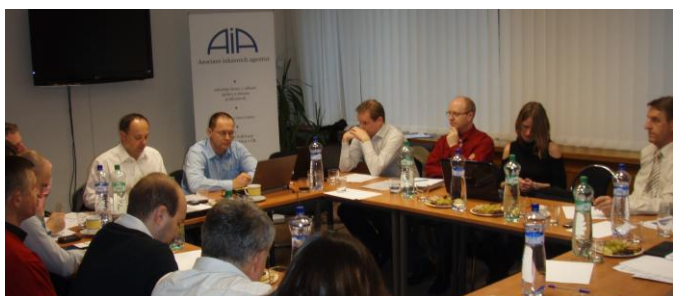
Zasedání VH AIA 7.12.2011

Dále byly schváleny všechny předložené změny stanov Asociace, mezi něž patří například možnost uložit finanční sankci inkasní agentuře, která porušuje Etický kodex či nekoná v souladu se stanovami Asociace. Jedním z bodů programu VH bylo také hlasování o přijetí nových členů do AIA. Novým řádným členem AIA se k 1.1.2012 stává ryze česká společnost Credit One, a. s. a novým přidruženým členem se k 1.2.2012 stává společnost UNIDEBT Czech, SE . AIA se nyní dostává k počtu 18 členů.